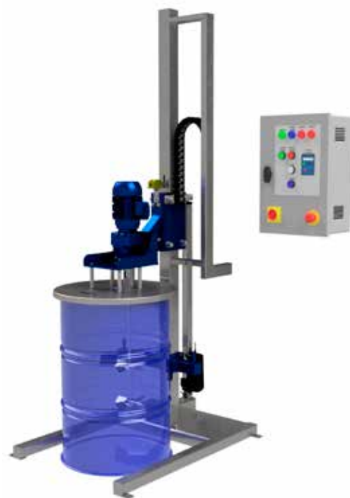
Stație de mixare pentru butoaie