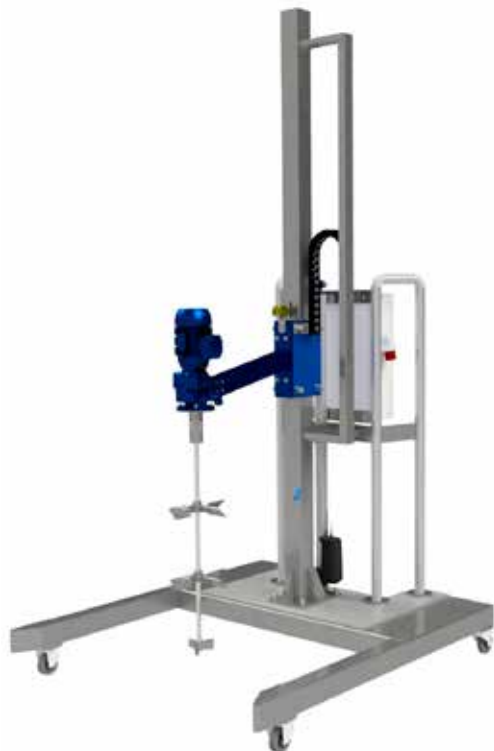
Stație de mixare mobilă